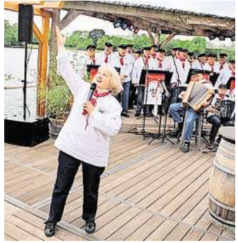
Der Eröffnungchor des Shantychor-Festivals mit einer Solistin des Seemannschores Hannover.